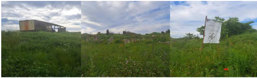
Приложение №5: Обект палеопарк „Вършец“, 2024 г.